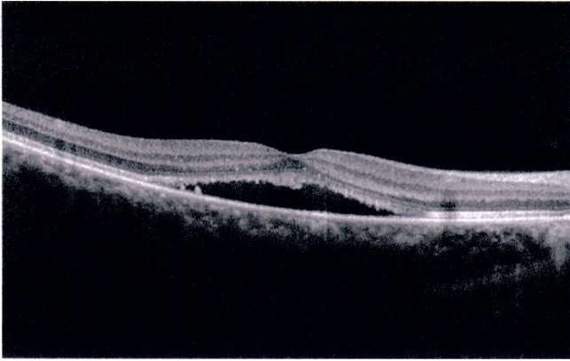
Esta imagen muestra cómo la coriorretinopatía serosa central causa la inflamación en las capas de la retina.