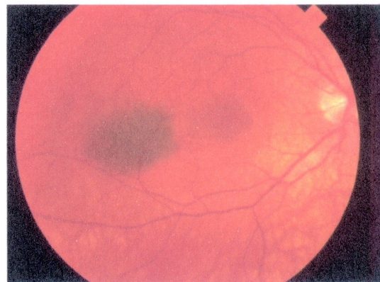
Un nevo debajo de la retina (nevo coroidal)

Las personas pueden nacer con nevos. Si el punto pigmentado se desarrolla mas tarde en su vida, tambien suele ser benigno, pero el riesgo de que se convierta en un cancer es mayor.